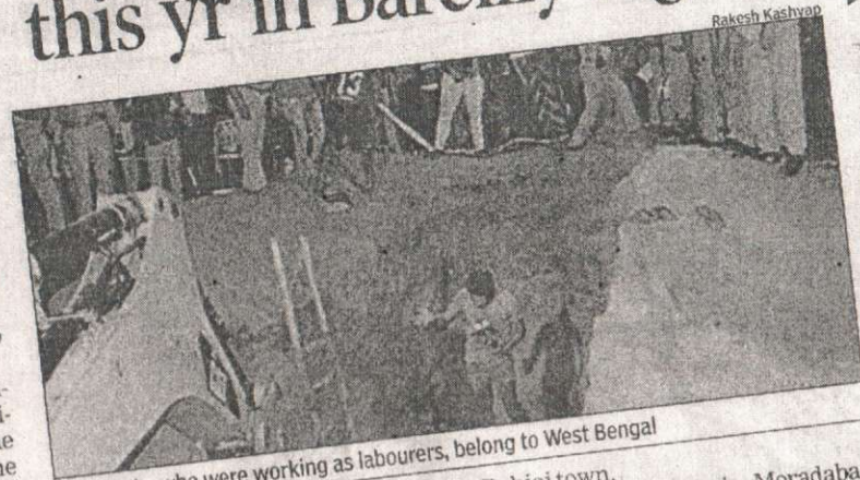
Six people, who were working as labourers, belong to West Bengal Bahjoi town.

Bareilly: As many as 20 persons, including 12 women, have been buried alive this year in the region in several incidents of cave-ins. Experts say that the laterite soil in the region is rich in iron and aluminium but the upper layer of the solid clay reduces the retention capacity of the next layers causing frequent cave-ins.